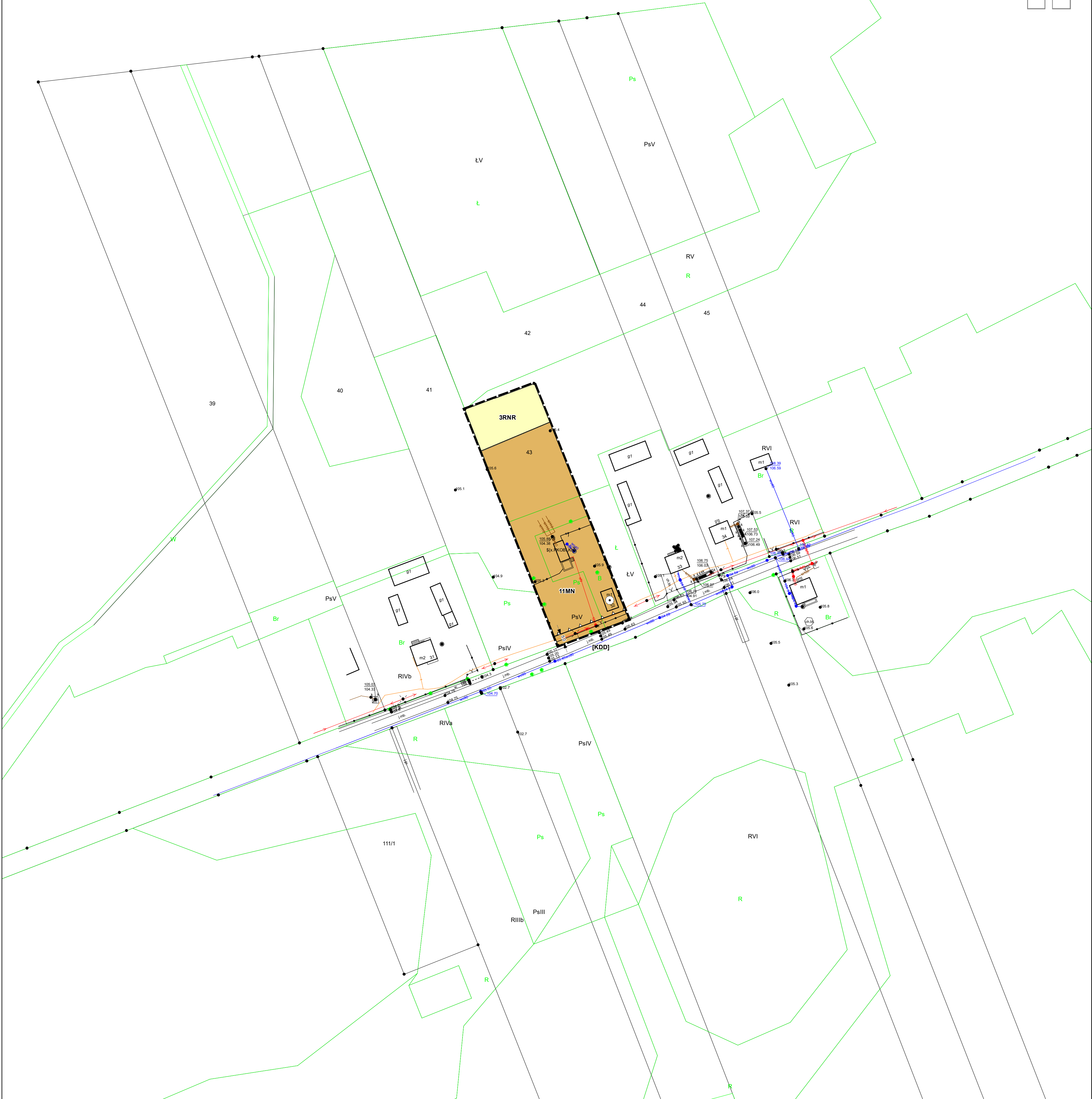
MIJESKOWY PLAN ZAGOSPODAROWANIA PRZESTRZENNEGO GMINY DŁUGOSIODŁO NR 7