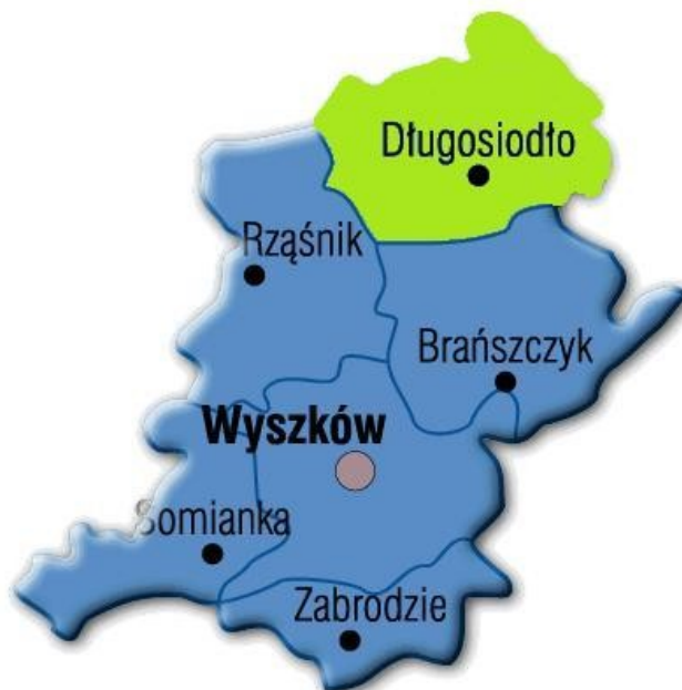
Schemat nr 1. Lokalizacja gminy Długosiodło

Liczba mieszkańców gminy na dzień 31 maja 2008 r. wynosiła 8.052 osób. Średnia gęstość zaludnienia gminy wynosi 48 osoby na 1 km 2 .